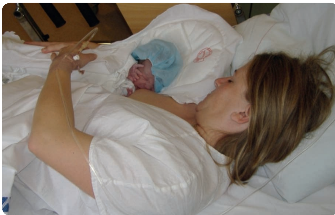
2012-ben már a Nyíri úton, az új Anya-gyermek Centrumban jöhetnek a világra a jövő polgárai

Néhány évet ugyan még várni kell arra, hogy az Izsáki úti kórház ajtajára végleg lakat kerüljön, de 2012-ben már a Nyíri úton, az új Anya-gyermek Centrumban jöhetnek a világra a jövő polgárai. A Megyei Önkormányzat által benyújtott pályázat ugyanis mostmár minden bizonnyal zöld utat kapott.