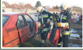
A tűzoltók utánpótlása nagy kihívás elé állítja az egyesületeket.