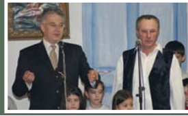
Semjén Zsolt csodálatát fejezte ki a dusnokiaknak az élő hagyományápolásért.