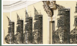
A hajósi kastély építészeti- művészeti- és kultúrtörténeti adottságait tekintve is az egyik legjelentősebb épület az alföldön.