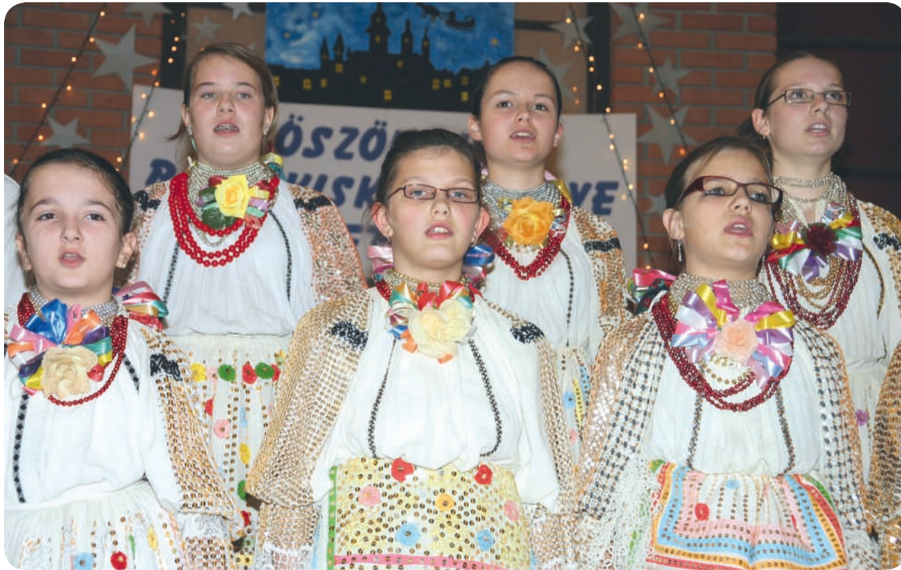
Látványnak sem mindennapi élményt nyújtott a hercegszántói hagyományörző kórus színes előadása.