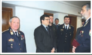
Bács-Kiskun Megye a fokozottan veszélyeztetett státusza miatt a katasztrófavédelem vezetői nagy figyelmet szentelnek a megelőzésre.