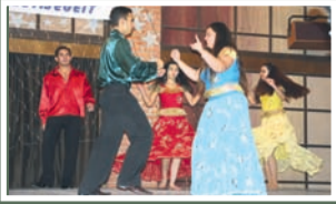
A Karaván együttes idén Weiblingenben is vendégszerepel.