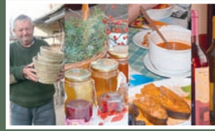
A hungarikumok egyedülálló nemzeti értéket képviselnek.