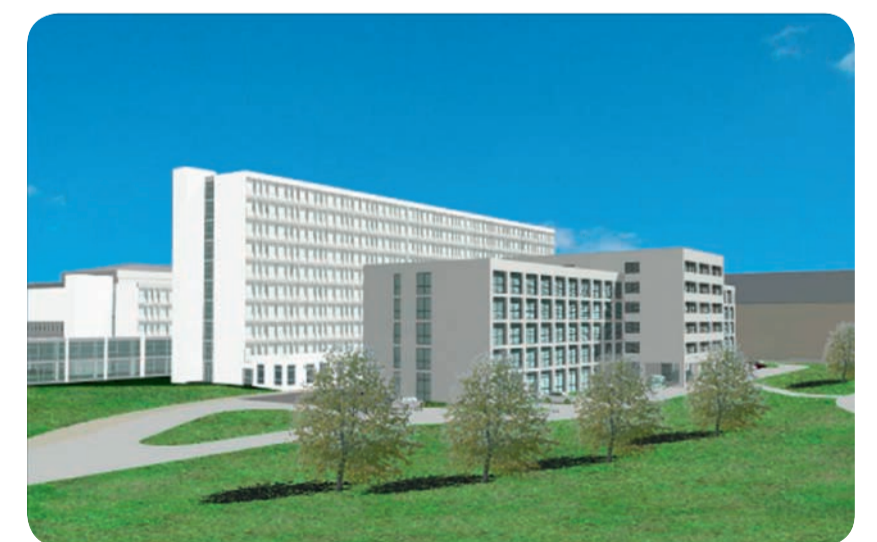
A megújuló kórház centralizálja az egészségügy teljes területét, felszámolja a különböző telephelyeket.

Európaibb viszonyokat szeretnénk megszűnnének végre a méltatlan körülmények, melyek az eddigi ötven-hetven évvel ezelőtt épült, 51 épületben üzemelő létesítményeket jellemezték. A megyei egészségügyi szolgáltatásokhoz történő hozzáférés ma kirívóan egyenlőtlen a nagy távolságok és az alacsony kapacitás miatt. Tízezer lakosra jelenleg 54,9 ágy jut, az országos átlag pedig 70,1. Az életminőséget befolyásoló tényezők sajnos kedvezőtlenül hatnak a lakosság egészségi állapotára, a jelenlegi körülmények pedig nem teszik lehetővé a hatékony egészségügyi szolgáltatást. Már pedig